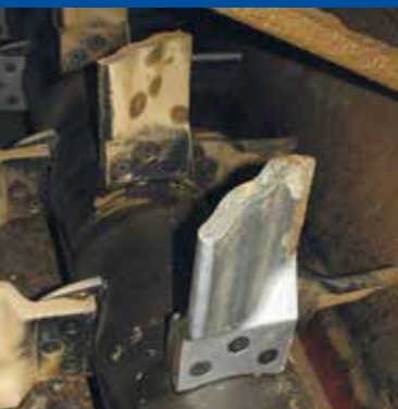
Vergleich unterschiedlicher Materialien beim Einsatz in Schwertwäschen